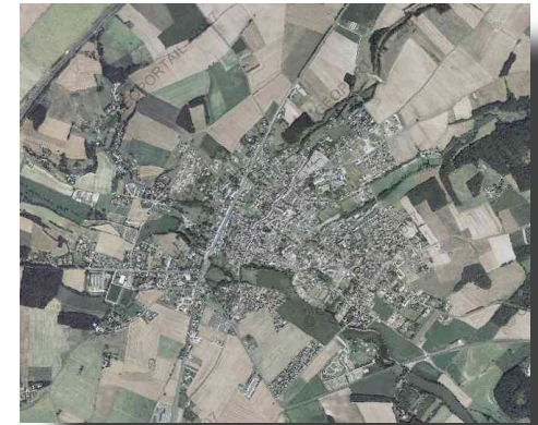
Sainte-Maure de Touraine, vue du ciel