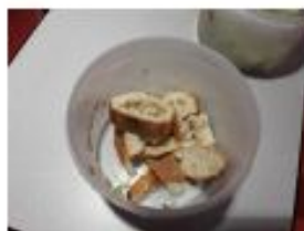
0,62 kg de pain