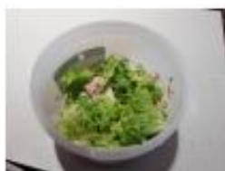
1,07 kg Toast de rillettes au thon sur chiffonnade de salade