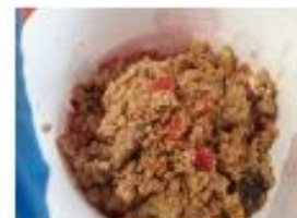
23,65 kg Qui noa aux petits légumes