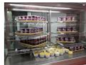
0,770 kg Fruits de saison

170 élèves au 1 er service n'ont pas aimé