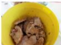
7,49 kg Côte de porc origine VPF Sauce aux cépes