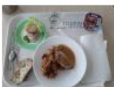
Un plateau proposé à un élève