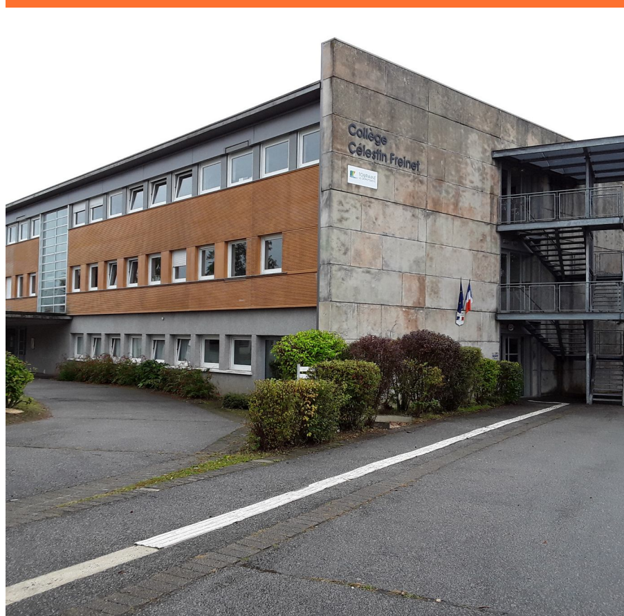
Collège C.Freinet, Ste-Maure-de-Touraine .© Ethan, 27 septembre 2021