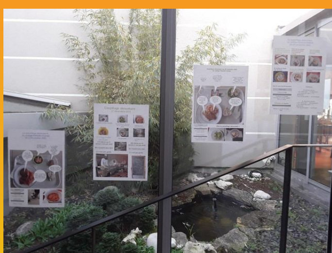
Collège C.Freinet, Ste-Maure-de-Touraine .© MLT, novembre-décembre 2022

Cette action a été menée du 28 novembre au 2 décembre 2022. Elle a mobilisée l'équipe de cuisine, de plonge, des éco-délégué(e)s, des professeur(e)s. Elle est dans la continuité des deux années précédentes :